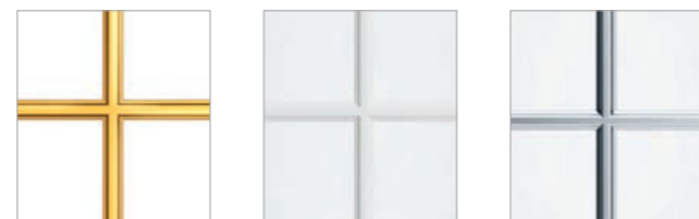
Klassisk guld 8 mm Aluminium vitlackerad 8 mm Aluminium silver 8 mm