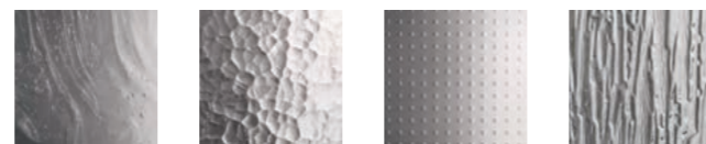
Altdeutsh Atlantic Master-Carré Niagara

Vi tillverkar isolerglasen i många olika kombinationer till våra fönster i vår egna glasfabrik. Allt från personsäkra glas, laminerade glas med inbrottskydd och en hel del andra kombinationer för att uppnå låga u-värden och bra ljustransmission. Vi använder oss av de flesta välkända glassorter på marknaden.