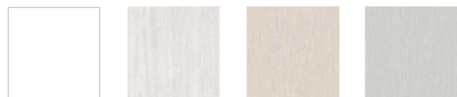
vit brilliantvit cremevit agatgrå

Vi har ett brett utbud av kulörer, nedan ser du några exempel.