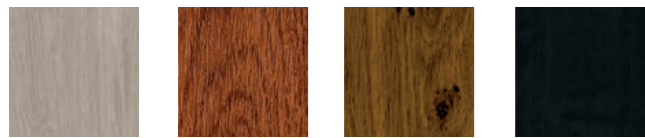
sheffield oak golden oak winchester antracit ådrad