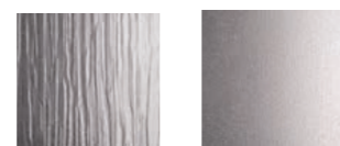
Kura clair Crépi (G200)