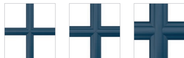
Finns i vitt, två-färg eller flera färger, storlek 18 mm Finns i vitt, två-färg eller flera färger, storlek 26 mm Finns i vitt, två-färg eller flera färger, storlek 45 mm